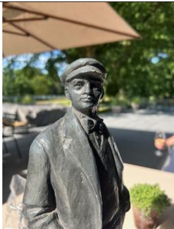
De oude opa – prooi van Jerry van de Weert, die een tijdgenoot zou kunnen zijn.....